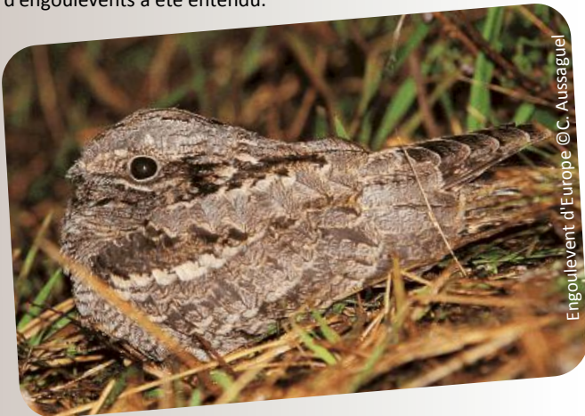
Engoulevent d'Europe

L'Engoulevent d'Europe est un oiseau migrateur crépusculaire à nocturne. Il rejoint notre territoire vers la fin du mois d'avril pour s'y reproduire et repart en Afrique tropicale orientale à partir de la mi-juillet. La journée, il passe souvent inaperçu grâce à son plumage brunâtre chiné. C'est à partir du coucher du soleil que son chant comparable au ronronnement d'un solex permet de détecter sa présence. Afin de mieux connaître la répartition de cette espèce sur le site Natura 2000 des «Corbières Occidentales», des prospections de nuit ont été réalisées entre la fin du mois de mai et la mi-juillet 2017. Au total, six carrés de deux kilomètres sur deux kilomètres, répartis sur l'ensemble du site dans des secteurs considérés comme favorables pour l'Engoulevent d'Europe, ont été prospectés avec l'appui de la LPO Aude une fois chacun durant cette période. C'est sur les communes de Pradelles-en-Val, Arquettes-en-Val et Montlaur que le plus grand nombre d'engoulevents a été entendu.