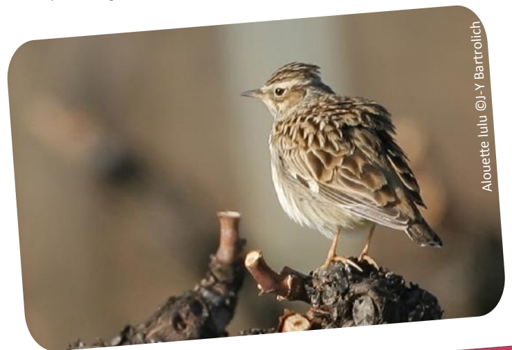
Alouette lulu

D'autres conférences et sorties seront proposées en 2018 pour poursuivre le travail de sensibilisation aux oiseaux du site. De plus, l'exposition sur les Oiseaux des Corbières continuera à cheminer sur le territoire. Rappelons d'ailleurs qu'elle peut être empruntée gratuitement sur demande.