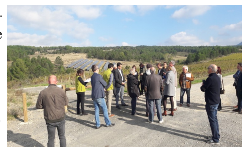
Présentation du parc photovoltaïque citoyen de Luc-sur-Aude

Cette visite a permis à l'équipe du projet de Parc de présenter l'avant projet de charte qui a intégré les remarques de l'avis d'opportunité de 2015.