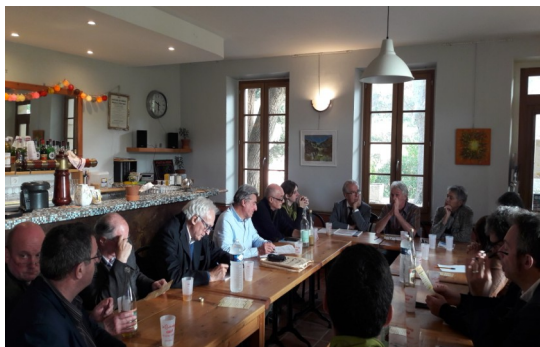
Rencontre avec le café-culturel « La Claranda » à Serres

Au fil de la visite sur le territoire, l'ensemble des thématiques ont été abordées avec la délégation et l'Avant-projet de Charte a ainsi pu être valorisé grâce aux différentes interventions de nos partenaires techniques. Les élus et l'équipe du PNR ont pu compter sur l'intervention des nombreux partenaires du projet pour aborder les différentes thématiques de la Charte. Ces interventions de grandes qualités ont permis de démontrer la forte concertation et l'implication des acteurs du territoire dans la construction de ce projet.