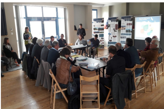
Accueil de la délégation à Luc-sur-Aude

L'avis intermédiaire, comme cela avait été le cas à l'étape de l'avis d'opportunité en 2015, nécessite une visite des rapporteurs (CNPN, Ministère et Fédération des Parcs). Elle a eu lieu les 22, 23 et 24 octobre derniers.