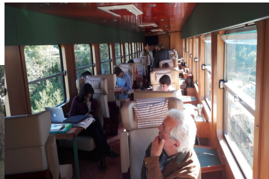
A bord du Train du Pays Cathare et du Fenouillèdes

Les élus du syndicat du PNR Corbières-Fenouillèdes tiennent à remercier à nouveau l'ensemble des acteurs et techniciens qui se sont mobilisés pour participer à cet événement.