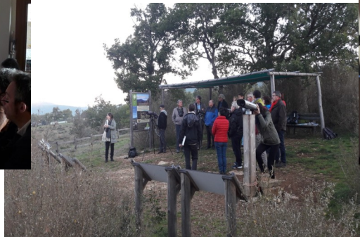
Passage à l'observatoire à vautours de Bugarach