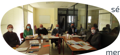
Audition avis final -23/11/20

régionaux de France et du CNPN a confirmé la qualité de ce travail.