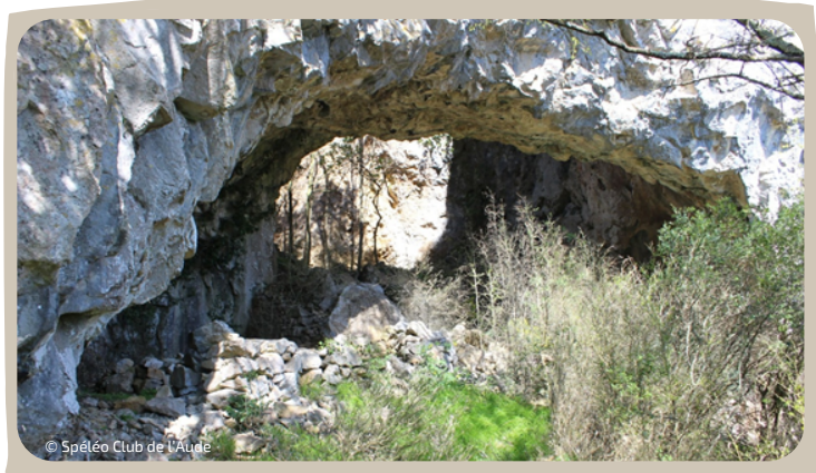
Arche naturelle, Géosentier Roc Nitable

La chargée de mission patrimoine géologique travaille actuellement à l' aménagement-équipement de certains géosites du futur PNR. A ce titre, deux projets de géosentiers multithématiques sont actuellement à l' étude sur les communes de Lagrasse et de Termes, respectivement le Géosentier des Capitelles et le Géosentier du Roc Nitable.