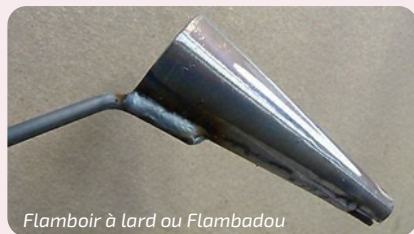
Flamboir à lard ou Flambadou

« un soir d'été, fenêtres ouvertes vous entendez "tic tic tic tic tic tic", c'est la demi-lune qui hache le lard pour en faire un petit farci nommé farcou »