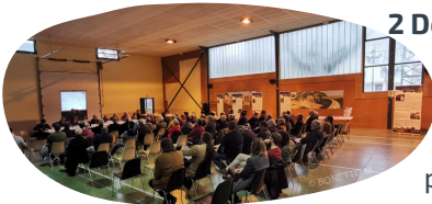
Comité syndical - 28/02/20

Les collectivités avaient alors initialement 4 mois (durée légale de la procédure) pour s'exprimer sur