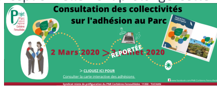
Bannière mail & couverture Facebook adhésion des collectivités

Au 31 août, 98 communes, 6 EPCI et les 2 Départements ont délibéré.