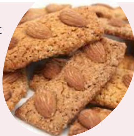
Croquant aux amandes

En attendant, honneur à ce petit gâteau sec allongé au zeste de citron, doré à l'œuf et recouvert de 2/3 amandes dans lequel tout habitant du Fenouillèdes à un jour... « croqué » : le Croquant de Saint-Paul-de-Fenouillet . Voyage dans le temps, entre histoire et souvenirs d'enfance pour ce produit « patrimonial ».