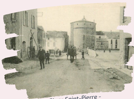
Place Saint-Pierre - Saint Paul de Fenouillet

"O sources de l'Agly, gouffre et pont de « La Fou » Qu'on admirait à deux, en croquant des « Biscottes » Et qui m'avez rendu, tour à tour, triste et fou, Quand l'Angélus du soir tintait au creux des grottes"