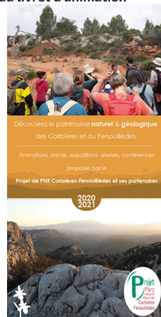
Page de garde du livret 2020/2021

Pour tout renseignement sur les sorties : m.bonetto@corbieres.fenouilledes.fr