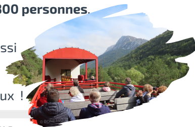
Sortie Train Rouge -12/10/19

L'année 2020 s'annonce tout aussi riche en découvertes nature, restez connectés sur nos réseaux !