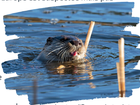
Loutre d'Europe - Lutra lutra

Depuis l'installation avérée de ce carnivore opportuniste en amont de la Vallée de l'Orbieu en 2016, l'objectif du suivi biennal mis en place en 2013 a évolué. En effet, cet hiver, celui-ci sera double : estimer le nombre d'individus potentiel dans la partie amont du site et jauger des limites de sa colonisation en partie aval. Ainsi, en plus de rechercher les indices de présence de la loutre, à savoir ses excréments (ou épreintes), qui jouent un rôle très important dans la communication entre individus, les chargés de mission souhaitent approfondir leur enquête ! Lorsque les niveaux d'eau auront baissé, c'est donc avec le soutien d'un spécialiste de la Fédération Aude Claire et le déploiement de quelques pièges photos, que l'équipe essaiera de comprendre la dynamique de colonisation de cette espèce sur le périmètre Natura 2000.