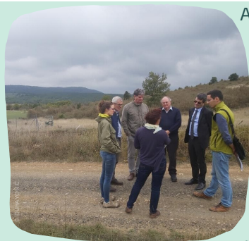
Visite du territoire - 14/10/19

Après une visite sur le territoire en octobre, accompagnée par les élus du Bureau syndical et l'équipe technique, l'Autorité Environnementale a analysé le dossier et a émis son avis le 6 novembre 2019. Dans le cas d'une Charte de PNR l'analyse des effets prévisibles sur l'environnement est bien sûr très