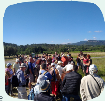
Sortie nature Lagrasse -16/06/19

En cette année 2019, le syndicat mixte s'est doté d'un livret d'animation sur le patrimoine naturel et géologique. Une quinzaine d'animations a été proposées sur les 6 sites Natura 2000. Plus de 60 personnes sont venues échanger autour de Natura 2000 et de la biodiversité lors de l'événement « de ferme en ferme » à Lagrasse. En tout près de 300 personnes ont participé aux sorties, stands et conférences proposées. Lors de ces animations, les participants ont pu découvrir les oiseaux des Corbières, leurs chants, leur migration ou leur sensibilité aux dérangements ; ainsi que les chauves-souris et leur magnifique balai nocturne. Le public a également pu en apprendre davantage sur des espèces particulières au cours de conférences ou sorties qui leur étaient dédiées. À la tombée de la nuit, à Maury, certains ont découvert l'Engoulevent d'Europe, ce mystérieux oiseau crépusculaire.