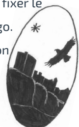
Exemple de logo récolté

plusieurs emblèmes fortement appréciés par les citoyens dont les châteaux et les rapaces . Le Syndicat doit désormais fixer le nombre définitif d'emblèmes qui figureront sur le logo. La démarche se poursuivra ensuite avec sa conception graphique auprès d'un prestataire.