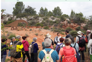
Sortie géologie -Albas- 09/06/19

ont été bien accueillies. Les diverses sorties proposées étaient sous plusieurs formats : stands, découvertes inédites in-situ, conférences permettant ainsi de faire participer différent type de public. Au total, les animations 2019 proposées et financées par le programme LEADER « conduite de l'action de préfiguration pour la reconnaissance du patrimoine géologique » menées avec les acteurs et partenaires locaux ont permis de rassembler plus de 300 personnes.