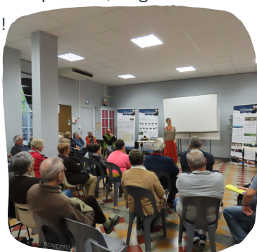
Atelier de collecte Caudiès-de-Fenouillèdes - 24/10/19

Contactez l'animateur : collecte.memoire@corbieres-fenouilledes.fr