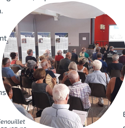
Réunion publique de Saint-Paul de Fenouillet -22/07/19

Ces réunions publiques ont permis de rassembler environ 330 personnes du territoire des Corbières-Fenouillèdes et de répondre aux diverses interrogations de chaque concitoyen.