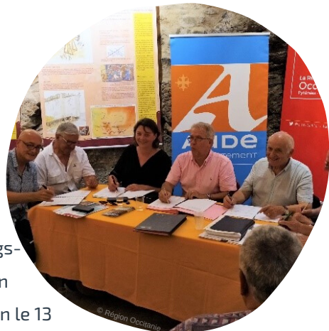
Signature du contrat territorial Termes - 24/07/19

sera soumis à l'approbation du COPIL, en même temps que les contrats « bourgs-centres » en commission permanente de la Région le 13 décembre 2019.