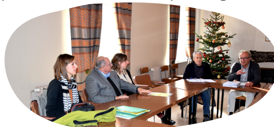
Conférence de presse Durban-Corbières -16/12/19

Les élus et l'équipe du PNR sont aussi intervenus sur les radios de RCF Pays d'Aude, France Bleu Roussillon et Pyrénées FM. Au cours de ce dernier grand rendez-vous de concertation et dans le cadre de la procédure officielle, les concitoyens ont pu donner leurs avis sur l'ensemble du projet de Parc et notamment sur la Charte de Parc, document de référence pour les 15 ans à venir.