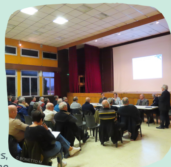
Réunion auprès des collectivités, Latour de France-04/02/20

Les assemblées ont ainsi pu découvrir les projets de Statuts du futur Syndicat mixte de gestion qui portera l' animation et déploiera l'ensemble des dispositions inscrites dans la Charte de Parc. Au total, 69 élus du territoire ont participé à ces quatre réunions et 45 collectivités étaient représentées .