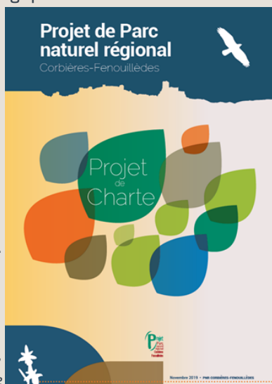
Projet de Charte - Page de garde

Le décret de classement final sera ensuite délivré par le Premier Ministre.