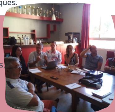
Réunion de travail avec les services de la Région

Par ailleurs, suite à un travail d'animation partenarial avec l'Association du Pays de la Vallée de l'Agly, les EPCI et les communes, 7 contrats « bourg centre » ont été élaborés au cours du dernier trimestre 2019 et coordonnés par le syndicat. L'objectif de tous ces contrats étant le renforcement des centralités et de leur rayonnement sur le territoire.