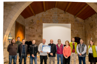
Remise Charte Natura 2000, Abbaye de Fontfroide -24/01/20