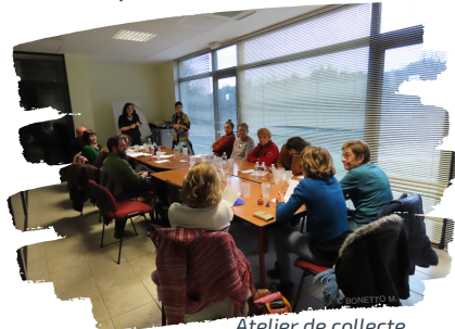
Atelier de collecte, Tuchan -12 & 13 /12/19

Contactez l'animateur : collecte.memoire@corbieres-fenouilledes.fr